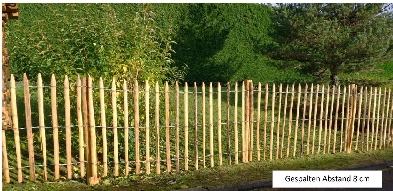
Gespalten Abstand 8 cm